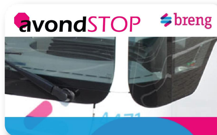
Voorbeeld avondSTOP kaart:

Nog niet iedereen is overgestapt op de OV-chipkaart, of maakt gebruik van een anonieme OV-chipkaart. Voor deze mensen moet er de mogelijkheid zijn om een avondSTOP kaart aan te vragen via de website van Breng. Na verificatie van het geslacht en leeftijd wordt de avondSTOP kaart opgestuurd naar het huisadres van de passagier. Verificatie kan plaatsvinden door het uploaden van een kopie van het paspoort/ID-kaart of inloggen met een DigID account.