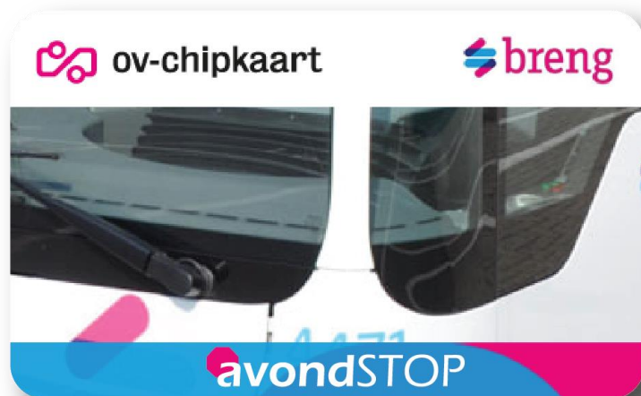
Voorbeeld OV-chipkaart met avondSTOP:

sectie waarop staat dat de passagier binnen de doelgroep valt, en eventueel de geldigheidsduur. De geldigheidsduur geldt voor jongens die de leeftijd van 13 hebben bereikt (dus buiten de doelgroepen komen te vallen) tijdens de geldigheidsduur van de OV-chipkaart.